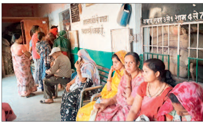
राशन पाने के लिए दुकान में हितग्राहियों को घंटों करना पड़ रहा इंतजार।

अप्रैल महीने से पीडीएस हितग्राहियों को एक साथ तीन महीने का राशन दिया जा रहा है। एक साथ राशन लेने के लिए हितग्राहियों को छह बार थम्ब लगाना पड़ रहा है और इधर सर्वर डाउन होने की समस्या कम नहीं हुई है। जिसकी वजह से हितग्राहियों को राशन लेने घंटों इंतजार करना पड़ रहा है। समस्या यह भी है कि केवल चावल ही तीन महीने का दिया जा रहा है शक्कर और नमक नहीं। शक्कर और नमक लेने के लिए दूसरे व तीसरे महीने यानी मई और जून में भी दुकान आने की जरूरत पड़ेगी। मौजूदा स्थिति की वजह से हितग्राही परेशानी महसूस कर रहे हैं।